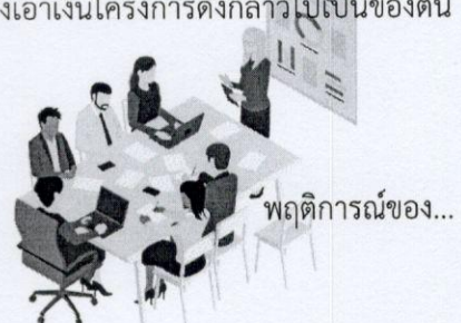
พฤติการณ์ของ...